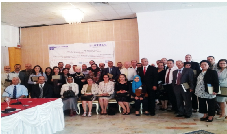
Photo de groupe clôture des deux sessions